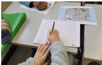
© Aïda Rabia, Travail des élèves, 2025