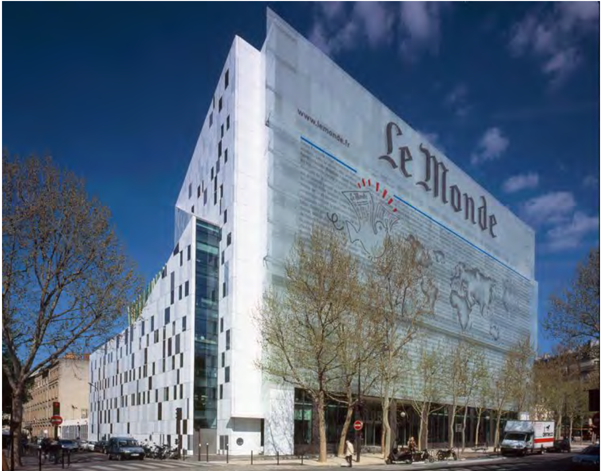
Siège du quotidien Le Monde boulevard Auguste-Blanqui, Paris 13ème

Le 18 décembre 2014 le journal Le Monde fête la parution de son premier numéro. A l'instar d'autres titres de la presse française qui fêtent eux aussi leurs 70 ans, ce journal est né à la suite des ordonnances prises par le pouvoir à la Libération par le gouvernement provisoire de la République française. Ces ordonnances ont complètement redessiné le paysage de la presse française, abolissant la censure, rétablissant la liberté de la presse, réorganisant économiquement ce secteur et promulguant la dissolution ainsi que la confiscation des biens de tous les titres ayant collaboré avec les Allemands. Ces mesures ont touché près de 90% des titres de la presse quotidienne de l'époque. Sous l'égide du général de Gaulle et de Georges Bidault, président du Conseil National de la Résistance, le journal Le Monde succède ainsi au journal Le Temps dont il reprend les locaux et l'équipe. Sa direction est confiée à Hubert Beuve-Méry en vue d'en faire un journal de prestige. Très vite, ce dernier cherche à émanciper le journal des cercles du pouvoir et à partir de 1951 la société des rédacteurs du Monde est chargée de veiller à son indépendance éditoriale.