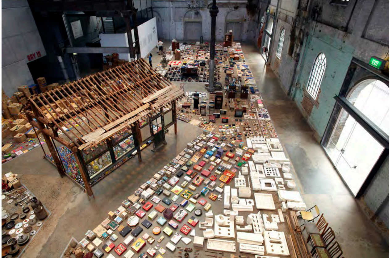
Waste Not. Song Dong, Museum of Modern Art, New York, 2006.