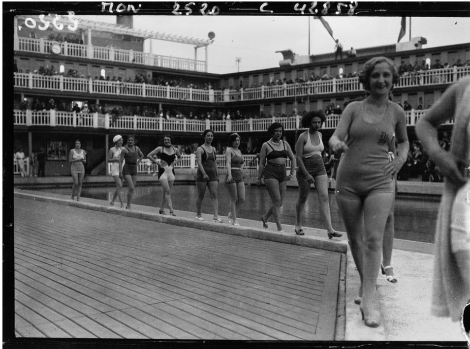
Gala nautique des artistes de Paris, piscine Molitor 1932 / Agence Mondial Bibliothèque nationale de France, Département des Estampes et de la photographie [EI-13 (2949)]

L'art et la mode forment depuis quelques décennies un tandem complémentaire. En 1965, Yves Saint-Laurent inspiré par Mondrian crée une robe devenue depuis emblématique. Mais l'influence de l'art s'incarne aujourd'hui dans des créations percutantes d'où émane une émotion fondée sur le message politique qui l'a inspiré ; les créations d'Hussein Chalayan en sont un bel exemple.