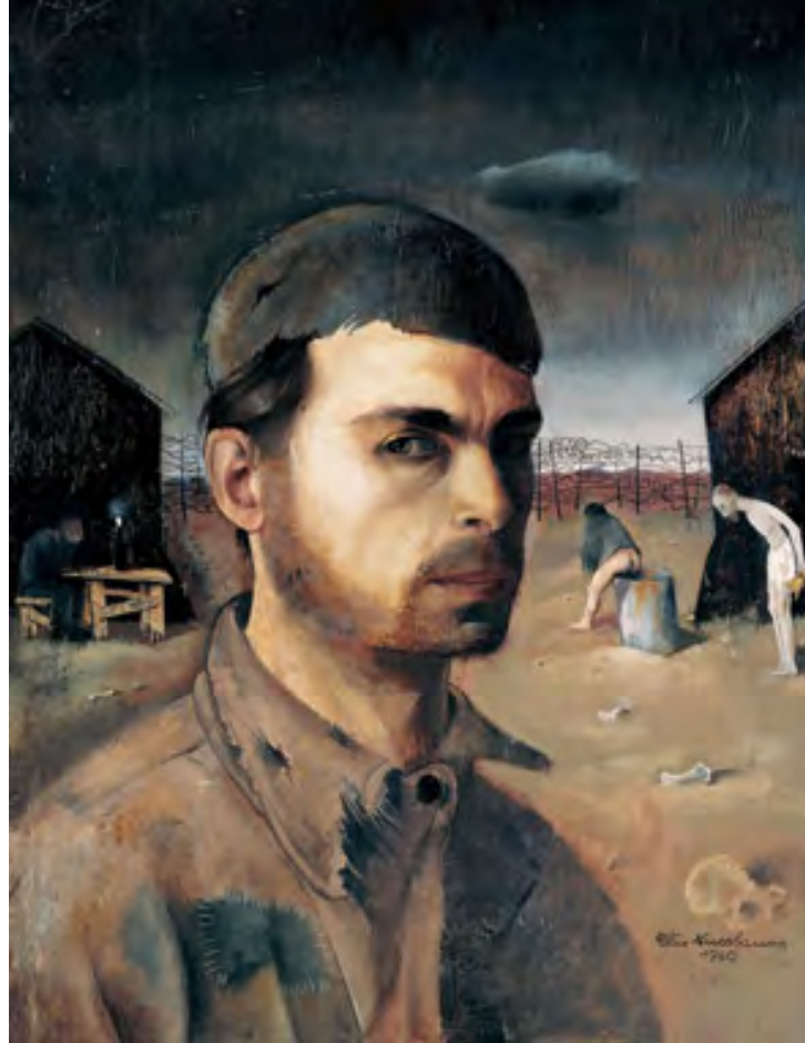
Felix Nussbaum, Selbstbildnis (1940)

En 2015, deux vidéos de l'artiste polonais Artur Zmijewski ont été retirées de l'exposition « My Poland. On recalling and forgetting » qui se tenait au musée d'art de Tartu en Estonie. Il s'agissait de « The game of Tag/Berek » dans laquelle des adultes nus jouent à chat dans une cave et dans une chambre à gaz, et « 80064 » où l'artiste a demandé à un déporté de retatouer son numéro de déporté. Aujourd'hui encore, il n'est pas simple de traiter ce sujet dans l'art contemporain. En effet, ce crime était prévu pour ne laisser ni traces ni témoins (on ne trouve par exemple ni film ni photo des chambres à gaz en fonctionnement), comment alors donner un sens visuel à cet événement ? Pourquoi et comment créer à partir de cela quand on a en tête les interrogations d'Adorno et de Claude Lanzmann. ? La question de la beauté revient elle aussi sans cesse : comment représenter l'horreur sans l'esthétiser ? Le photographe Michael Kennai a réalisé un travail sur les camps de concentration entre 1989 et 2000. Il répond à ce reproche à l'encontre de son projet en expliquant que si ses images sont séduisantes, c'est pour attirer le regard des spectateurs, et qu'ainsi ses photographies habitent leurs pensées.