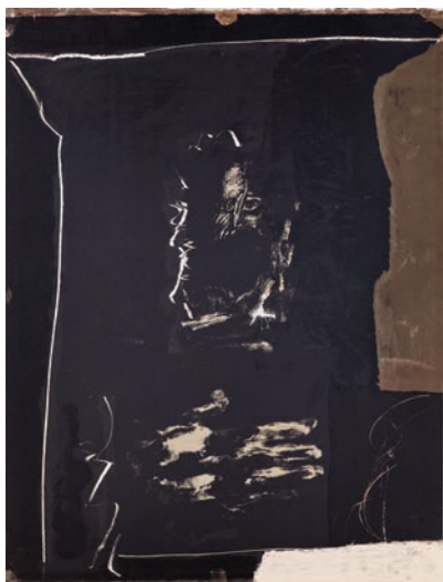
Antoni Clavé « El Caballero de ... », 1965 Lithographie en couleurs 65 x 50 cm BnF, Estampes et photographie © ADAGP, Paris, 2018

Les œuvres de l'ADAGP ( www.adagp.fr ) peuvent être publiées aux conditions suivantes : • Exonération des deux premières œuvres illustrant un article consacré à l'exposition de la BnF en rapport direct avec celle-ci et d'un format maximum d'1/4 de page • Au-delà de ce nombre ou de ce format les reproductions seront soumises à des droits de reproduction/représentation • Toute reproduction en couverture ou à la une devra faire l'objet d'une demande d'autorisation auprès du Service Presse de l'ADAGP.