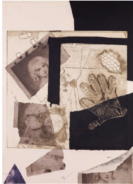
Antoni Clavé « Mille Marguerite », 1975 Carborundum en couleurs et gaufrage 78,5 x 56,6 cm BnF, Estampes et photographie © ADAGP, Paris, 2018