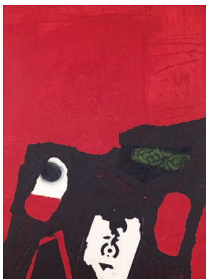
Antoni Clavé « Motillo blanc », 1971 Carborundum en couleurs et gaufrage 78 x 56,8 cm BnF, Estampes et photographie © ADAGP, Paris, 2018