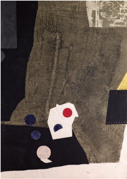
Antoni Clavé « Sac et chiffre 3 », 1974 Aquatinte, carborundum en couleurs et gaufrage 91 x 63,5 cm BnF, Estampes et photographie © ADAGP, Paris, 2018