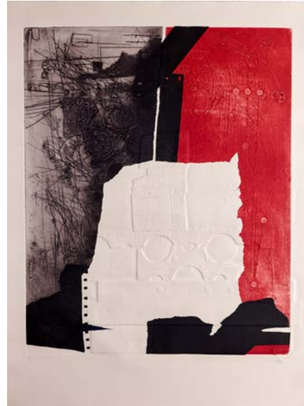
Antoni Clavé « Instrument étrange II », 1980 Eau-forte, carborundum en couleurs et gaufrage 100 x 75 cm BnF, Estampes et photographie © ADAGP, Paris, 2018