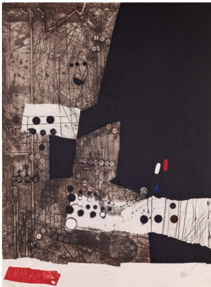
Antoni Clavé « Sans titre » ou « Instrument étrange », 1979 Eau-forte, carborundum en couleurs et gaufrage 76,5 x 56,5 cm BnF, Estampes et photographie © ADAGP, Paris, 2018