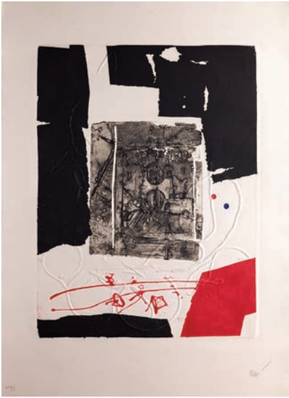
Antoni Clavé « Septembre 83 », 1990 Carborundum en couleurs et gaufrage 108 x 80 cm BnF, Estampes et photographie © ADAGP, Paris, 2018