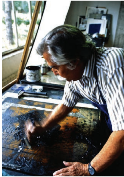
Clavé graveur, 1991