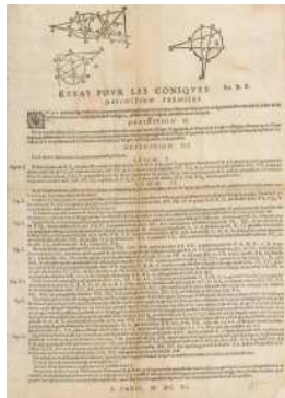
Blaise Pascal, Essai pour les coniques Paris, 1640 BnF, Réserve des livres rares