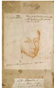
Jean Domat, portrait de Pascal, après 1662