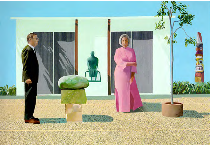
David Hockney. American collectors . Art Institute of Chicago, 1968