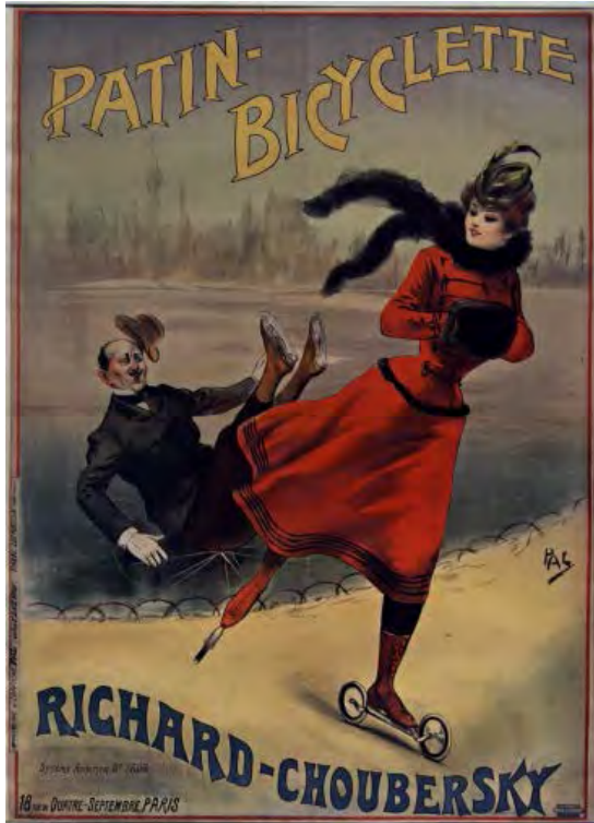
Pal. Patin-bicyclette Richard-Choubersky . Estampe. : lithogr. en coul. ; 130 x 94 cm. https://gallica.bnf.fr/ark:/12148/btv1b90164425/f1.item