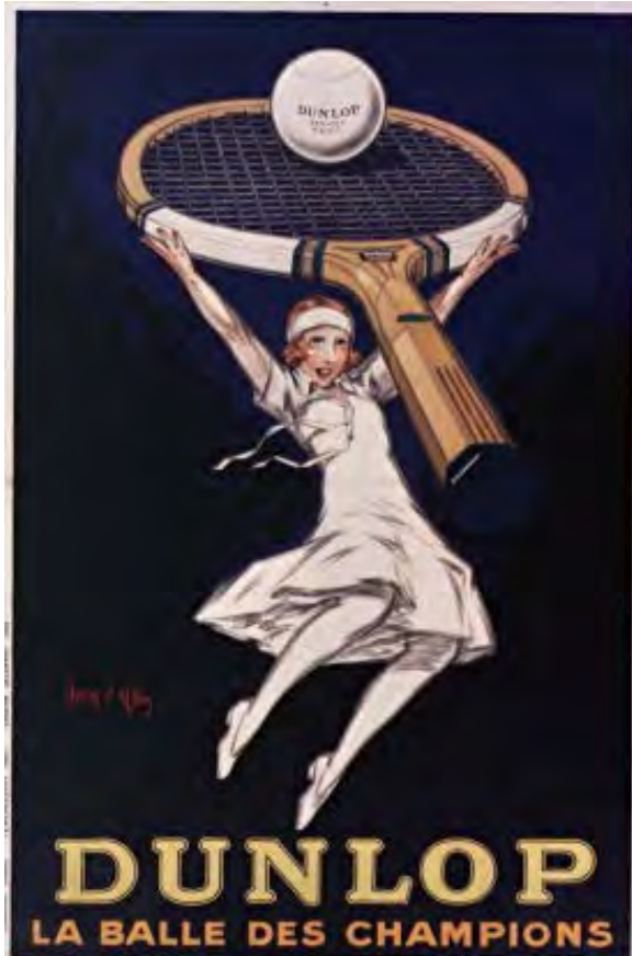
Jean d'Ylen. Ill.. Dunlop la balle des champions . estampe. : lithogr. en coul. 160 x 111 cm.

https://gallica.bnf.fr/ark:/12148/btv1b9011844t/f1.item