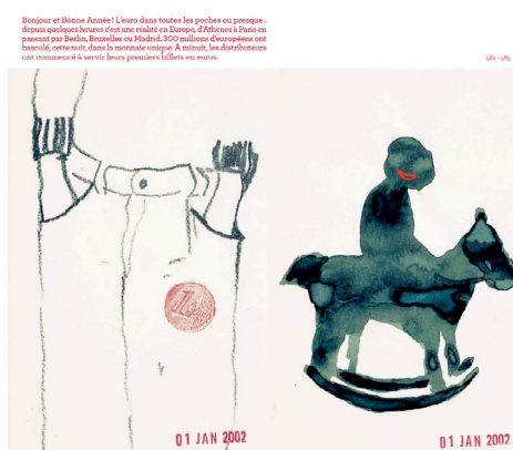
Françoise Pétrovitch, Radio Pétrovitch , 1er janvier 2002, Semiose éditions © A. Mole, Courtesy Semiose, Paris © Adagp, Paris, 2020