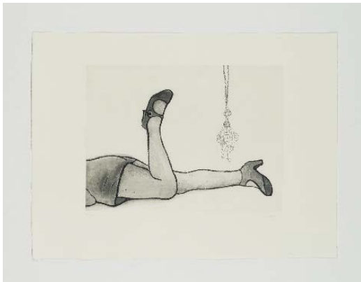
Françoise Pérovitch, Jambes (Les Sommeils) , 2011, gravure taille douce sur papier, 45 x 62 cm, édition René Tazé © A. Mole, Courtesy Semiose, Paris © Adagp, Paris, 2020