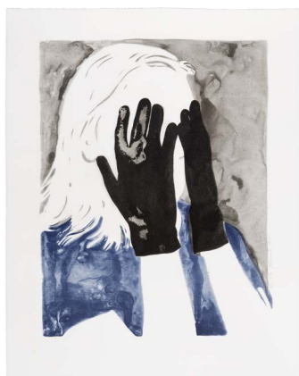
Françoise Pétrovitch, Derrière les paupières , 2019, lithographie, 50 x 38 cm, édition Tabor Press © Adagp, Paris, 2020