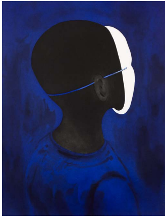
Françoise Pérovitch, Nocturne , 2017, aquatinte en bleu, 66 x 50 cm, édition MEL Publisher © BnF, département des Estampes et de la photographie © Adagp, Paris, 2020