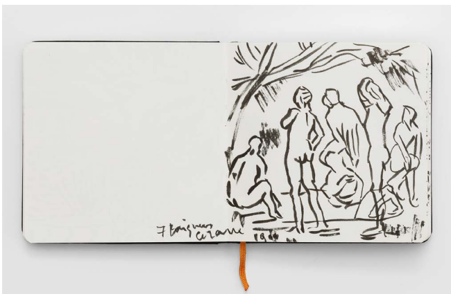
Françoise Pérovitch, Carnet de croquis © A. Mole, Courtesy Semiose, Paris © Adagp, Paris, 2020