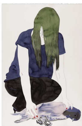
Françoise Pétrovitch, Dans mes mains , 2019, lavis d'encre sur papier, 120 x 80 cm