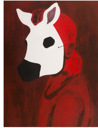
Françoise Pérovitch, Nocturne , 2017, aquatinte en rouge, 66 x 50 cm, édition MEL Publisher © Adagp, Paris, 2020