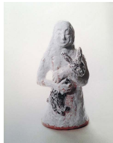
Françoise Pérovitch, Fille au lapin , 2004, céramique, 50 x 23 x 16 cm © Hervé Plumet, Courtesy Semiose, Paris © Adagp, Paris, 2020