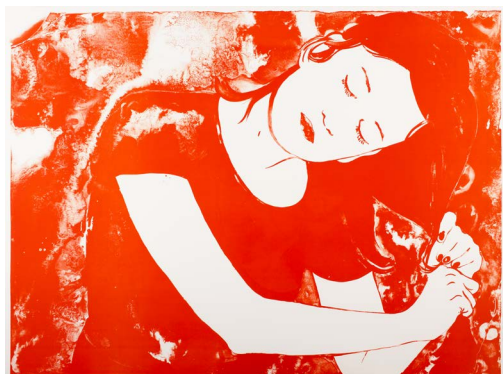
Françoise Pétrovitch, Se coiffer , 2016 lithographie, 120 x 160 cm, édition MEL Publisher © MEL Publisher, Courtesy Semiose, Paris © Adagp, Paris, 2020