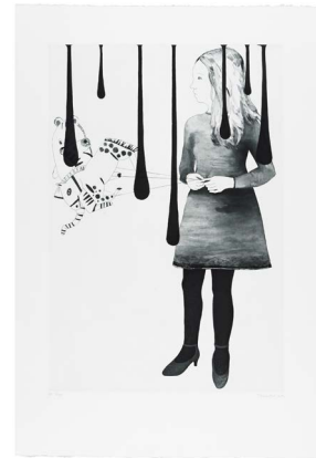
Françoise Pérovitch, Fille aux ballons , 2012, gravure taille douce sur papier, 108 x 76 cm, commande du CNAP - Nouvelles vagues © Adagp, Paris, 2020