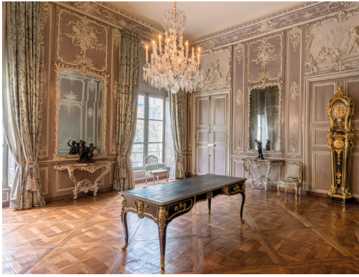
Salon de musique, bibliothèque de l'Arsenal

Cet ouvrage met en lumière la richesse de ses archives, mais aussi l'âme humaine qui habite encore ses murs, façonnée par des générations de penseurs et de créateurs.