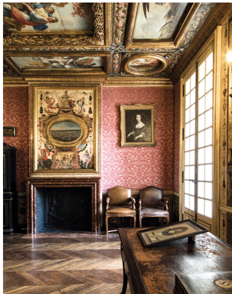
Chambre de la maréchale de La Meilleraye