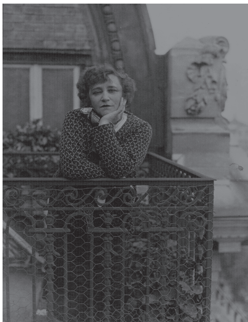
Colette (1873-1954)