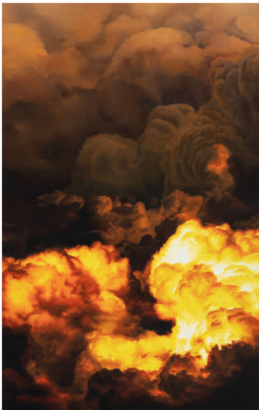
Anne Imhof Sans titre , 2022 Huile sur toile imprimée (détail) Collection privée