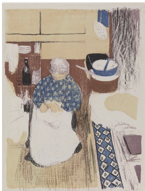
Édouard Vuillard (1868-1940) Paysages et intérieurs : La cuisinière (2 e état) Éd Ambroise Vollard, Paris, 1899 BnF, Estampes et photographie