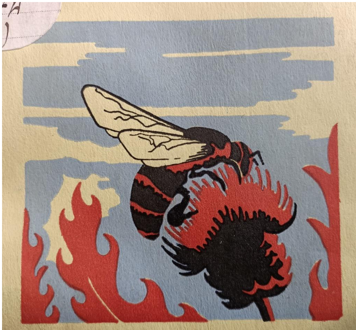
A. Brisset, H. Brisson, A. Delloue, [et al.], L'abeille et son travail. (Paris), 1946. [16-S-776] - [Détail de la couverture]